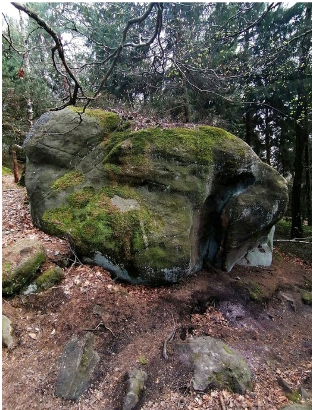
Obrázek č. 1/1